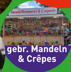
gebr. Mandeln & Crêpes