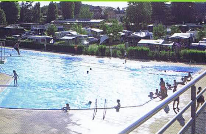
line ■ direct next to the swimming pool ■ direct naast het zwembad